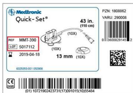
Oznaka na ovojnini seta